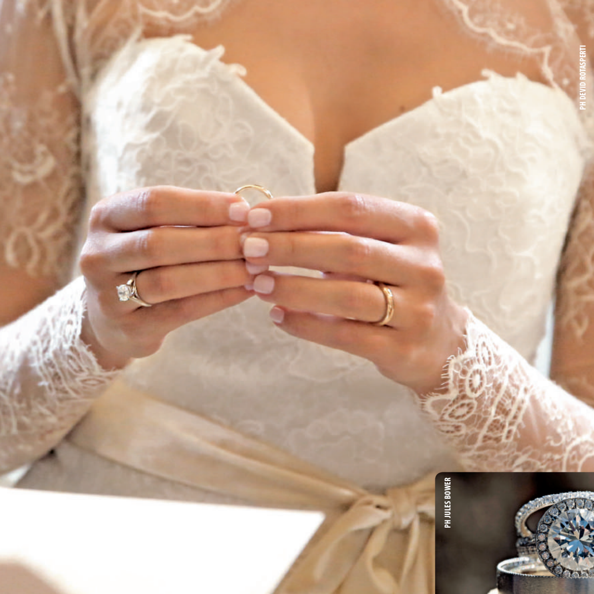
PH. DAVID ROTASPERTI