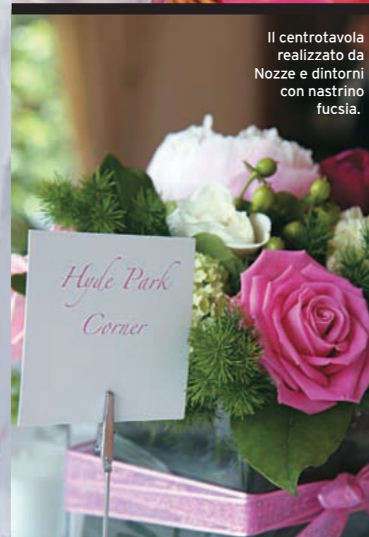
Il centrotavola realizzato da Nozze e dintorni con nastro fucsia.

I FIORI COME ospiti d'onore: ROSE, PEONIE ED ortensie, per un bouquet delicato, centrotavola QUADRATI e romantici cestini per le DAMIGELLE. Tutto nelle nuances del rosa. Dal pastello al più deciso FUCSIA.