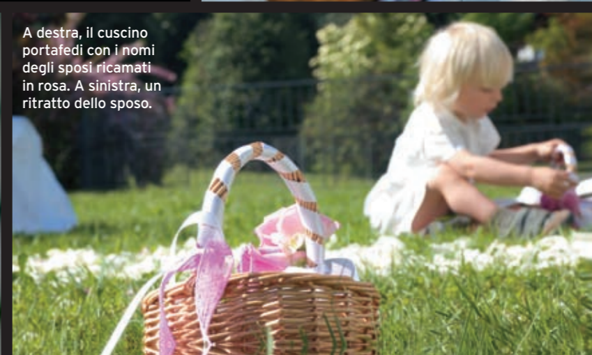
A destra, il cuscino portafedi con i nomi degli sposi ricamati in rosa. A sinistra, un ritratto dello sposo.