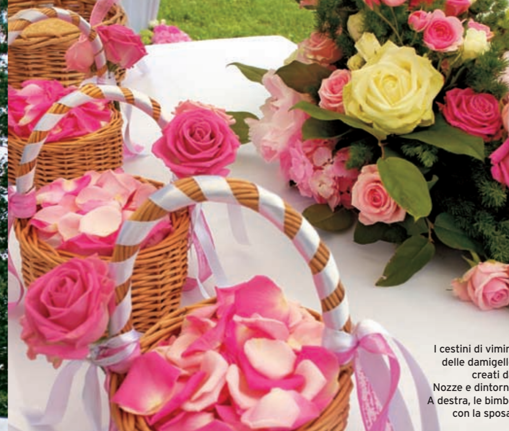
I cestini di vimini delle damigelle creati da Nozze e dintorni. A destra, le bimbe con la sposa.

Un evento all'insegna dei fiori. Così è stata questa cerimonia all'aperto, tutta giocata nei toni del rosa DI HEIDI Busetti