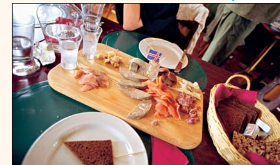
La cucina islandese è molto particolare, ha sapori ai quali non siamo abituati e fa sentire piacevolmente lontani da casa...

PER QUANTO non manchino gli alberghi, una delle soluzioni più quotate per dormire in Islanda sono le fattorie, aperte dagli agricoltori in estate. Diverse sono le possibilità di alloggio e le categorie con cui le fattorie vengono segnalate, anche se uno dei modi più semplici per avvistare in lontananza le Icelandic Farm Holidays è notare la presenza di una casetta, con doppio tetto a punta, colorata di verde. Lungo la costa ce ne sono moltissime, ma è consigliabile prenotare la camera già dall'Italia, dove vi saranno consegnati dei voucher con l'indirizzo dell'alloggio e la data. I prezzi e gli standard sono molto variegati, e vanno dal campeggio nello spazio adiacente alla fattoria, alle stanze con il bagno privato. Il sito web di questa associazione è www.farmholidays.is , mentre l'e-mail è ifh@famholidays.is Per quanto riguarda il cibo, vi consigliamo le zuppe, disponibili in ogni punto di ristoro e relativamente economiche, oppure i piatti di pesce. Il prezzi sono alti poiché vi è una forte e necessaria importazione di prodotti, mentre l'acqua è gratuita.