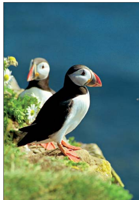
In alto, non è l'Ovest degli Stati Uniti, ma un canyon nel parco naturale di Jökulsárgljúfur. Sopra, la distesa di un campo di cotone artico, suggestiva quanto inaspettata, e una coppia di Pulcinelle di mare sulla scogliera di Látrabjarg: avvicinare questi uccelli non è particolarmente difficile, ma per tornare a casa con immagini come questa il teleobiettivo è indispensabile (qui abbiamo usato uno zoom 100-300mm impostato sulla focale massima). A sinistra, un'irrinunciabile "cartolina" realizzata sul lago Myvatn approfittando della luce suggestiva del tramonto nascosto dal cielo parzialmente coperto.